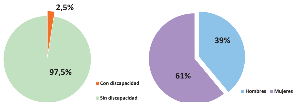
Graph 1. People qualified in Sociology according to situation of disability and sex.

Note: It should be taken into consideration that, for the purposes of estimating the volume of people qualified, the source used warns that "there is no information from the University Pablo de Olavide" (INE, 2016).